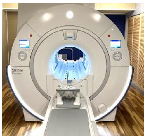
SIGNA Pioneer (GE)