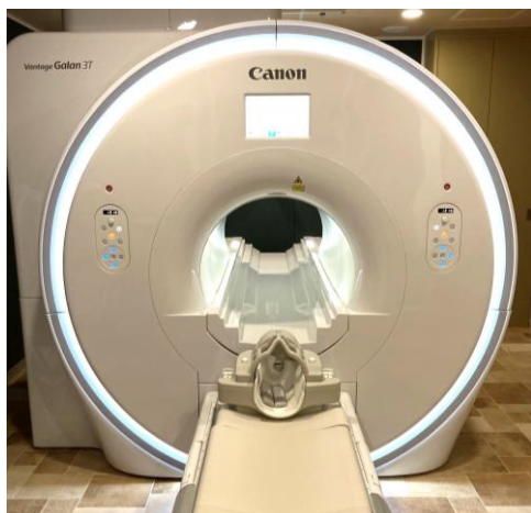
Vantage Galan 3T / Focus Edition (Canon)

このたび、3Tの磁場強度を持つ最新鋭高性能MRI装置2台が稼働を開始しました。以前の装置に比べ、画質の向上、検査時間の短縮、検査音の軽減などあらゆる面で優れており、これまでよりもストレスなく安心して検査を受けていただける装置となっております。今後とも何卒よろしくお願い申し上げます。