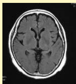
頭部断層画像 (頭部MRI)