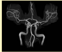
頭部血管画像 (頭部MRA)